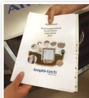
Varje enskilt uppdrag åtföljs av en skriftlig rapport.

Läs mer på www.amphi-tech.se Välkommen att kontakta oss!